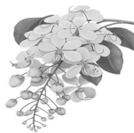
ดอกราชพฤกษ์ Ratchaphruk ( Cassia fistula Linn.)