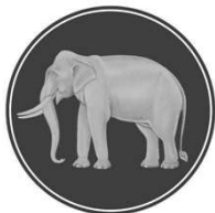
ช้างไทย Chang Thai (Elephant หรือ Elephas maximus )

(๑) เครื่องหมายการค้า เครื่องหมายบริการ เครื่องหมายรับรอง และเครื่องหมายร่วมที่เป็นภาพสัญลักษณ์ประจำชาติไทย คือ ภาพช้างไทย ภาพดอกราชพฤกษ์ ภาพศาลาไทย แบบที่ายประกาศฉบับนี้เป็นเครื่องหมายที่ต้องห้ามมิให้รับจดทะเบียน