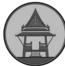
ศาลาไทย Sala Thai (Pavilion)

(๒) เครื่องหมายที่มีหรือประกอบด้วยลักษณะอย่างใดอย่างหนึ่ง หรือคล้ายกับภาพสัญลักษณ์ตาม